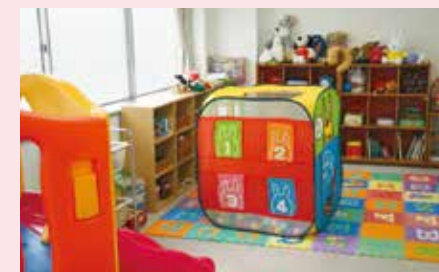
▲プレイルーム(プレイセラピーの部屋です)