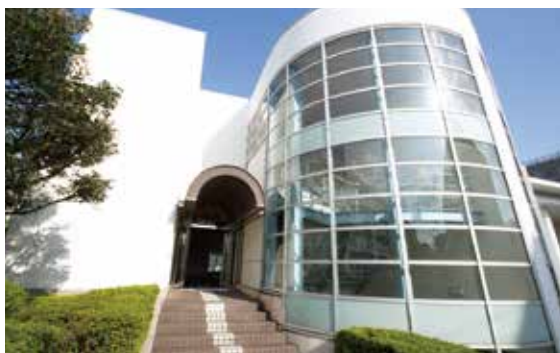
▲受付は東京成徳大学大学院の1階にあります。

上記の問題について、心理療法・カウンセリング、家族療法、遊戯療法、心理検査、コンサルテーションなどを行います。